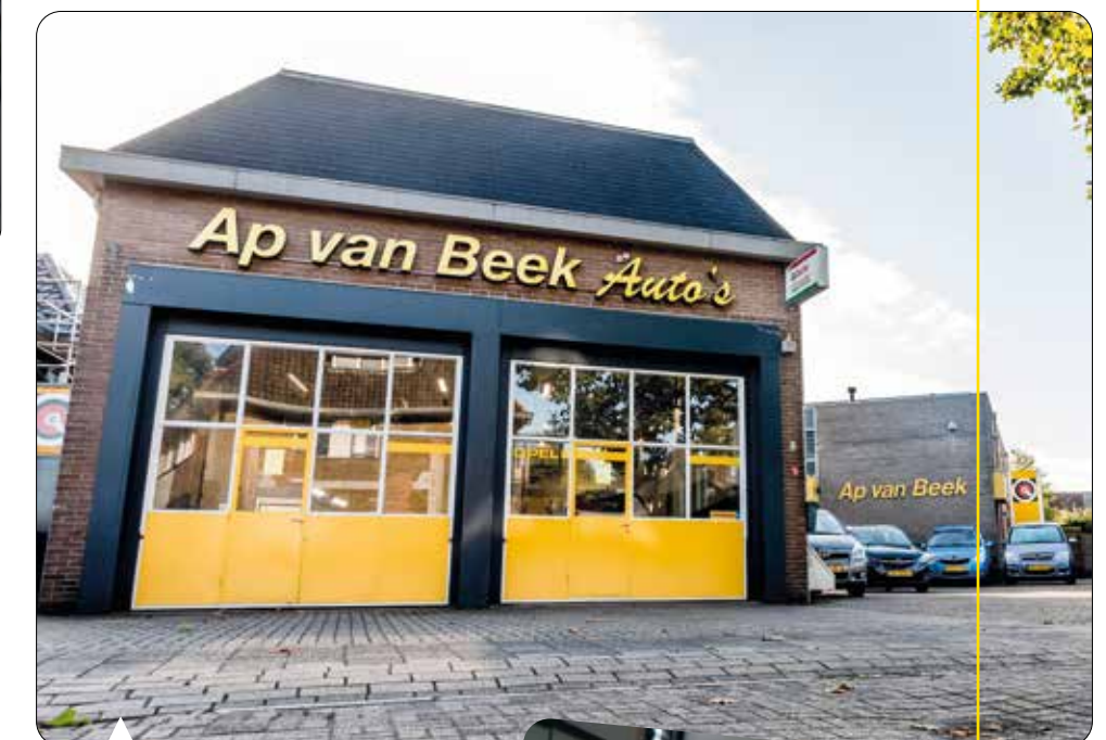
Pand Orderparkweg 3, Apeldoorn